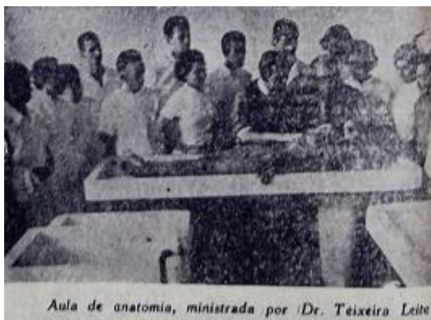
Figura 2: Aula de Anatomia do Curso de Medicina

Fonte: JORNAL DO MARANHÃO, p. 6, 27 jul. 1961.