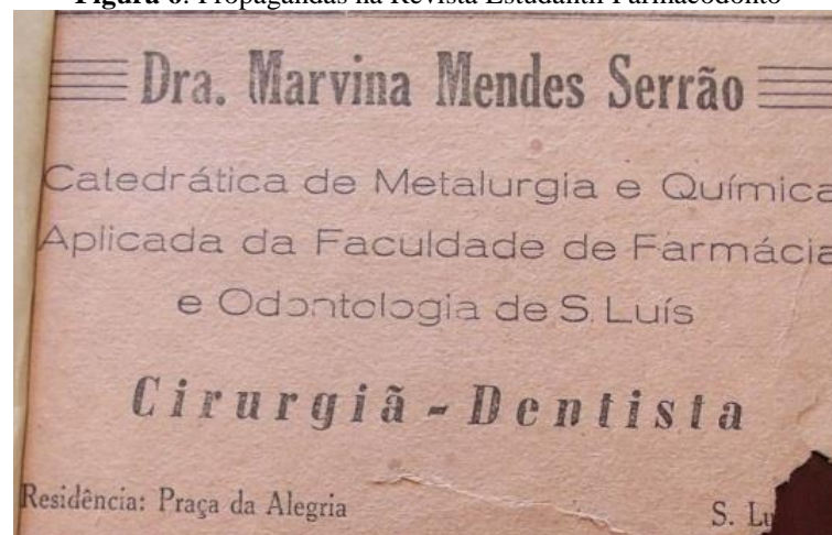
Figura 6: Propagandas na Revista Estudantil Farmacodonto