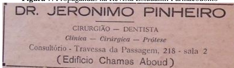
Figura 7: Propagandas na Revista Estudantil Farmacodonto