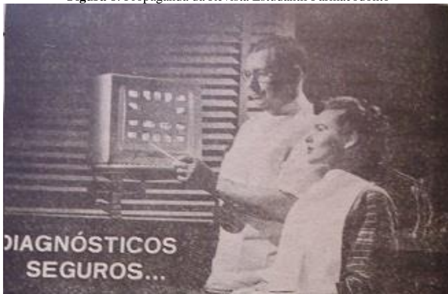
Figura 8: Propaganda da Revista Estudantil Farmacodonto

Nas poucas imagens que começaram a aparecer nas publicações da década de 1960, as mulheres sempre eram apresentadas como consumidoras e pacientes, a função profissional ainda era representação associada ao masculino. Como ilustra um exemplo abaixo: