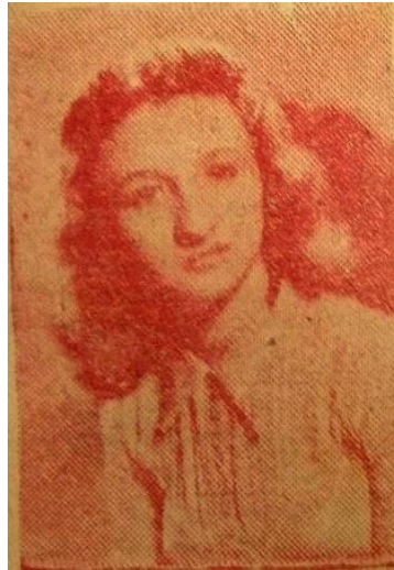
Figura 3: Rainha dos Calouros da Universidade do Maranhão (1958)